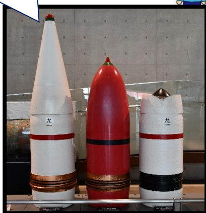
▲戦艦「大和」型 主砲弾