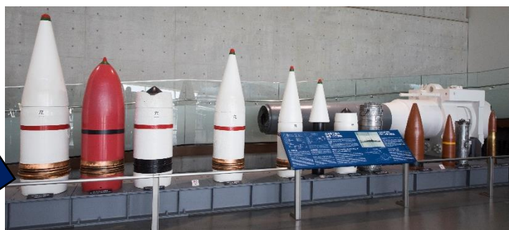
▲大和ミュージアム大型資料展示室内

戦艦「大和」の主砲弾は、1秒間に780mの速度（時速2,800km）で飛んでいき、約42km先に届きます。